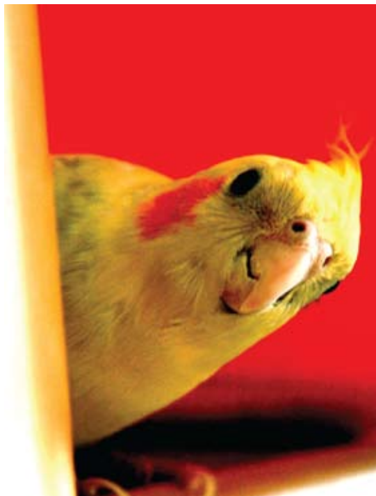
Savo šeiminkės dėka Švilpa išgarsėjo.