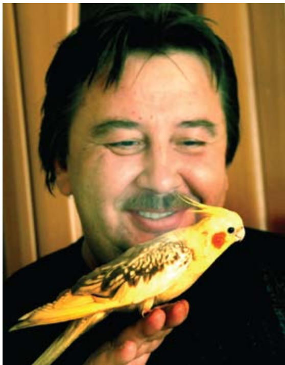
Gal Vytautas Vasiliauskas kada nors suras Švilpą kavalierių?