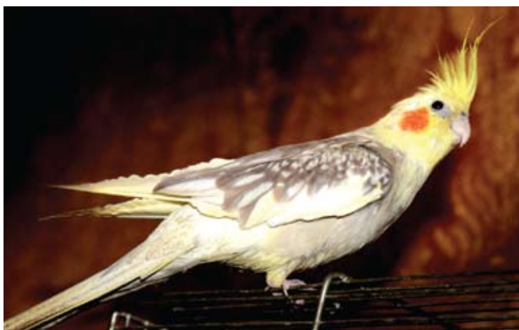
Švilpa nebūtų moteriškos giminės. Ji kruopščiai save prižiūri ir narvelyje netgi turi veidrodį.