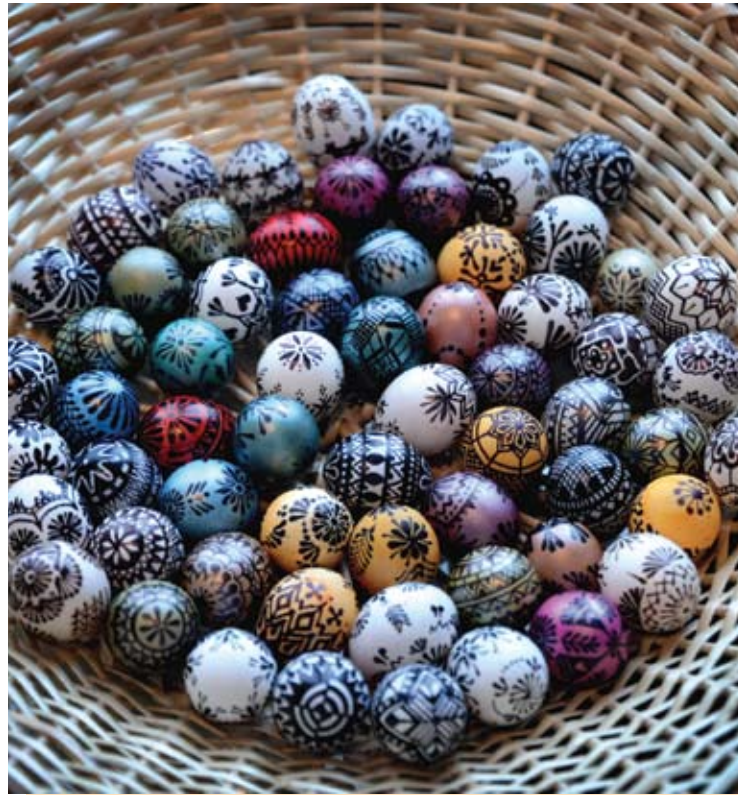
Velykiniai raštai ant papūgos Švilpos kiaušinių.